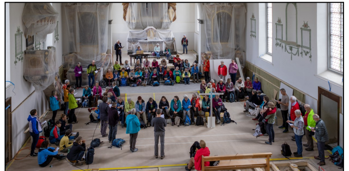
Halt in der Ulrichskirche in Wittenbach

Bei unsicherer Witterung ist die Maiandacht um 18.30 Uhr in der Pfarrkirche Häggenschwil. Telefon 1600, Rubrik 1 gibt Auskunft.